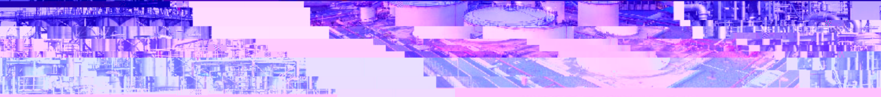
油气加工厂 Oil & Gas Refinery