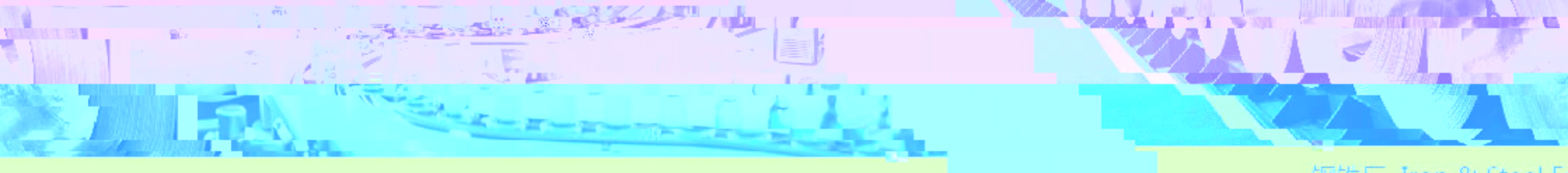
钢铁厂 Iron & Steel Mill